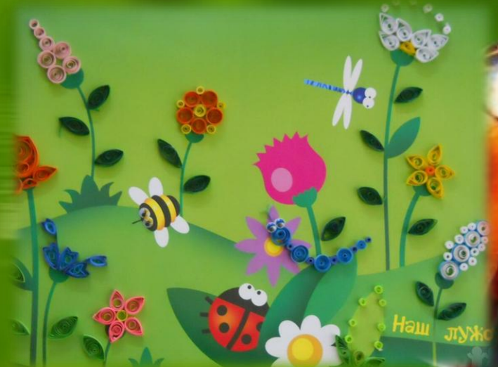
ФОТО С РАБОТАМИ ОТПРАВЛЯЕМ В ВАТТСАПП.