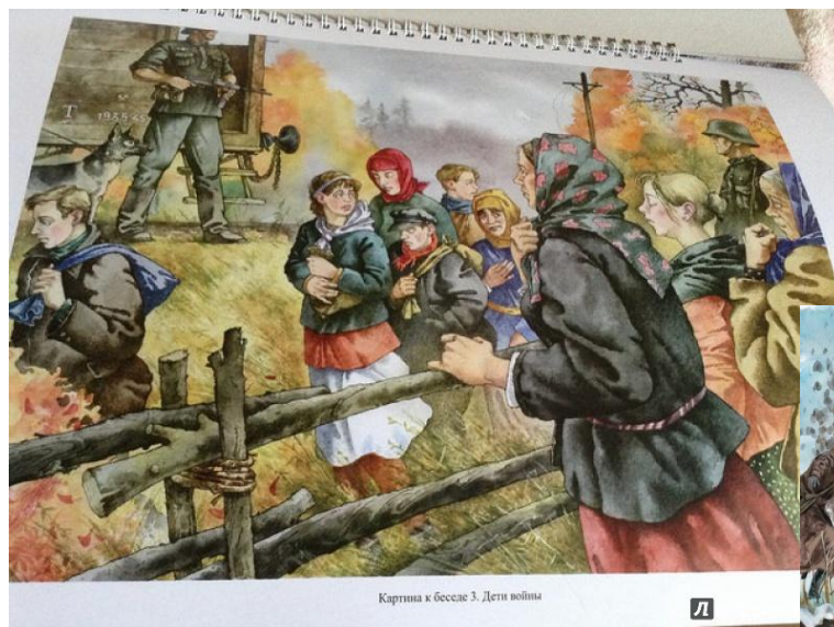
Картина к беседе 3. Дети войны