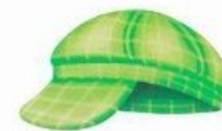
кепка или панама