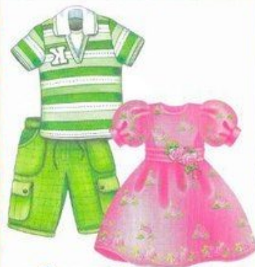
футболка+ шорты или платье