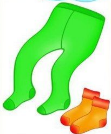
КОЛГОТКИ И НОСКИ