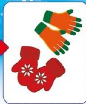
перчатки или варежки