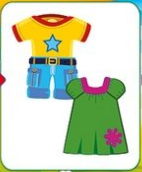
майка+ шорты или платье