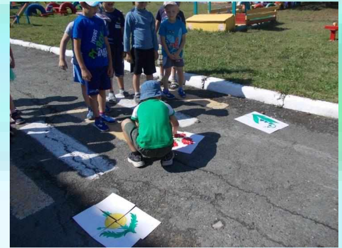
Подарок для мамы