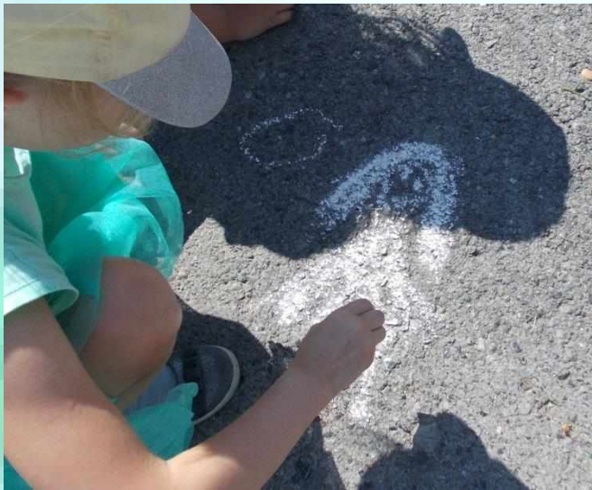
Конкурс « Моя семья»

Пришла пора нам отмечать День верности, любви, Желаем каждому из вас Любовь в душе хранить, Поддержку близких, их тепло Ничем не заменить!